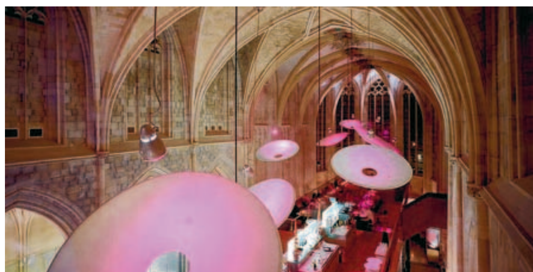
À Maastricht, un hôtel de luxe s'est installé au cœur d'une église. Le destin de Notre-Dame?