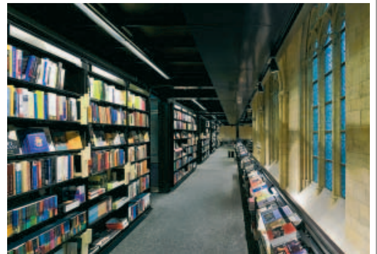
45.000 livres sont proposés à la vente!

ler ... et on ne peut l'y obliger. Cela aurait évidemment également des conséquences sur les autres librairies du centre-ville. Il faut bien calculer les pour et les contre. Faudrait pas mettre quelques petits indépendants en plus dans la merde. > Deborah Cette librairie hollandaise est évidemment superbe. Et la bibliothèque Venelle des Capucins peu avenante et vétuste. Si on peut transférer ce ne serait évidemment pas mal. > Max Pour une fois moi je trouve que c'est une bonne idée. > Et vous, quel est votre avis? Réagissez sur Expresso: http://blogs.sudpresse.be/expresso