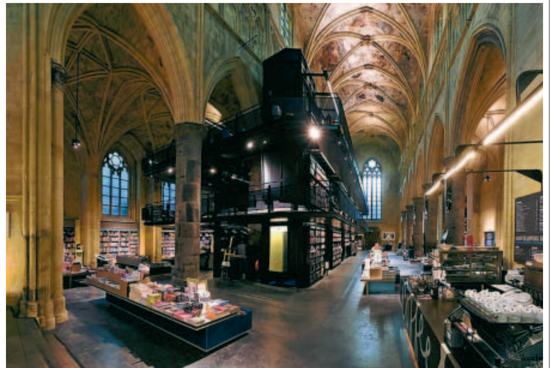
Pourquoi ne pas s'inspirer à Namur de la reconversion de l'église dominicaine de Maastricht?

L'église dominicaine de Maastricht est un chef-d'œuvre architectural du 13ème siècle, mais un chef-d'œuvre encombrant! Transformée au fil des époques en étable, local à guillotine, salle de boxe et, plus récemment, parking à vélos (voir photo), l'église a connu sa dernière mutation en 2006: une somptueuse reconversion en librairie, saluée par le Prix National de la Rénovation. Cette rénovation s'inscrit dans le cadre d'un énorme investissement privé (commerces et logements) de 110 millions d'euros dans le centre de Maastricht. La commune de Maastricht a subsidié la rénovation de l'église à hauteur d'un million d'euros; elle perçoit un loyer du libraire en échange de l'entretien du bâtiment. L'intégration de 45.000 livres dans un bâtiment pareil (trente mètres sous plafond!) n'a pas été pensée à la légère: la surface au sol de 750 mètres carrés est passée à 1.200 mètres carrés avec l'ajout d'un niveau intérieur. Les plus grands designers hollandais ont travaillé au mariage du design et