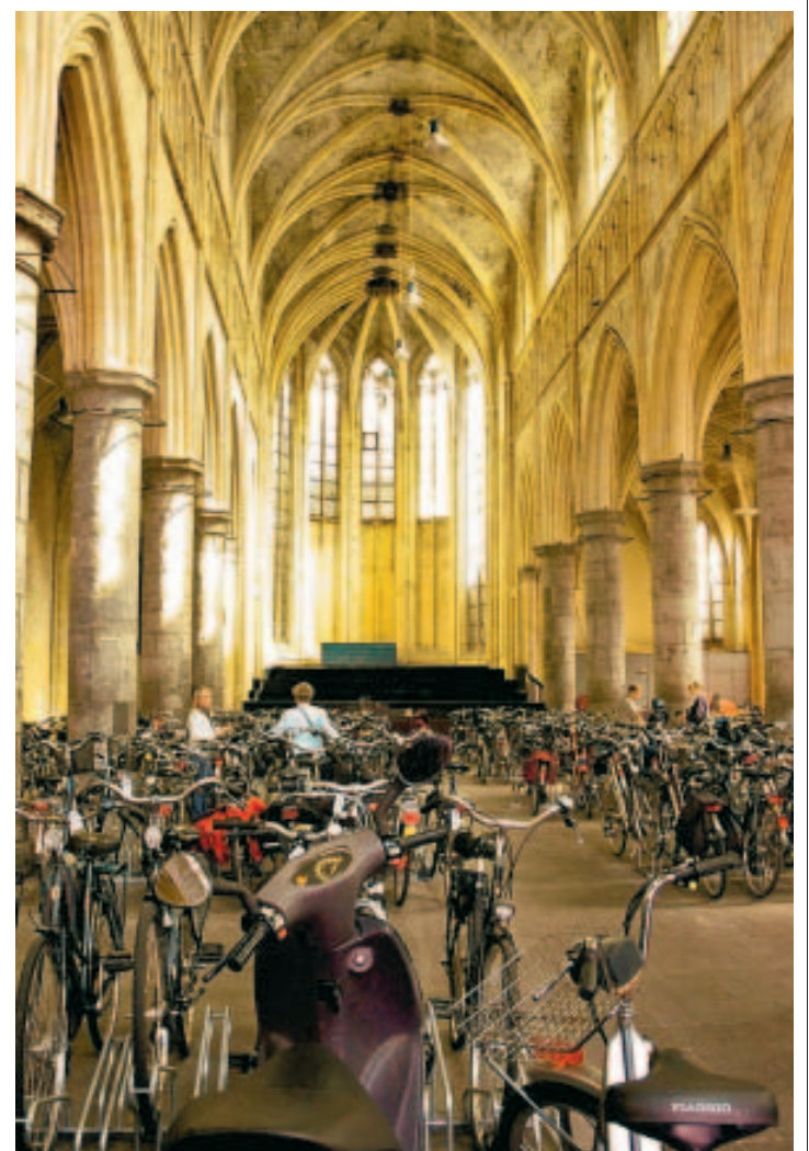
Avant 2006, l'église était utilisée comme parking à vélos!