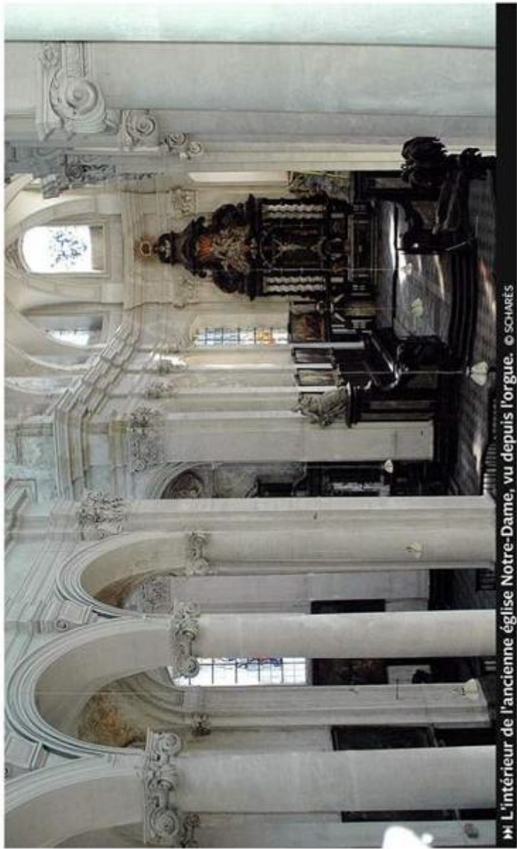
► L'intérieur de l'ancienne église Notre-Dame, vu depuis l'orgue.