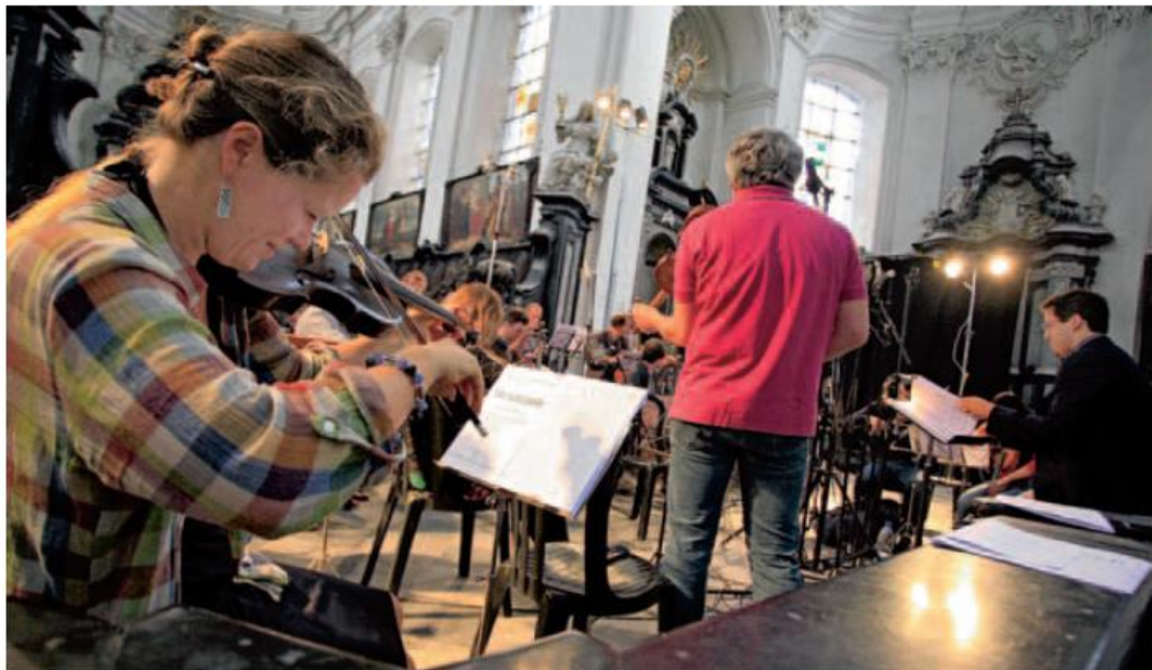
UN CD EST ENREGISTRÉ au sein de l'église Notre-Dame à Namur.