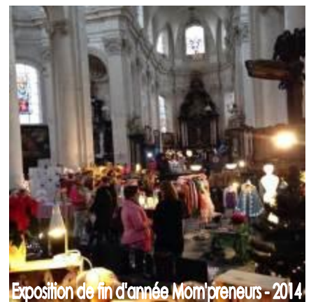
Exposition de fin d'année Mompreneurs - 2014