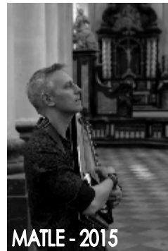
MATLE - 2015