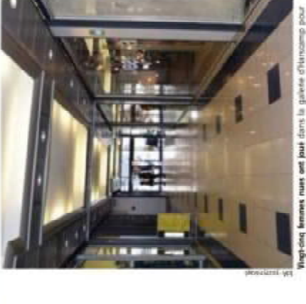
«Vingt-deux femmes nues ont joué dans la scène d'Harcamp pour le nouveau film de Jaco Van Dormael»