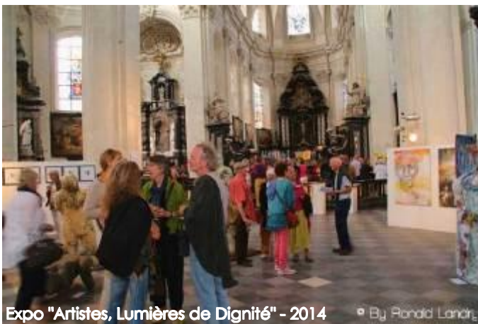
Expo "Artistes, Lumières de Dignité" - 2014