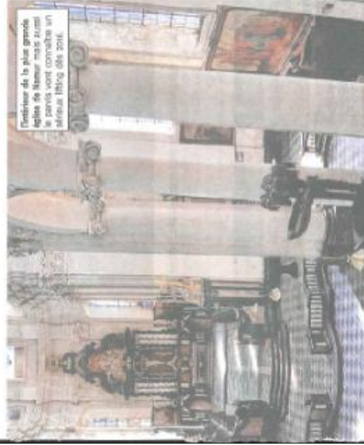
Intérieur de la plus grande église de Namur mais aussi le parvis vont connaître un sérieux lifting dès 2016.