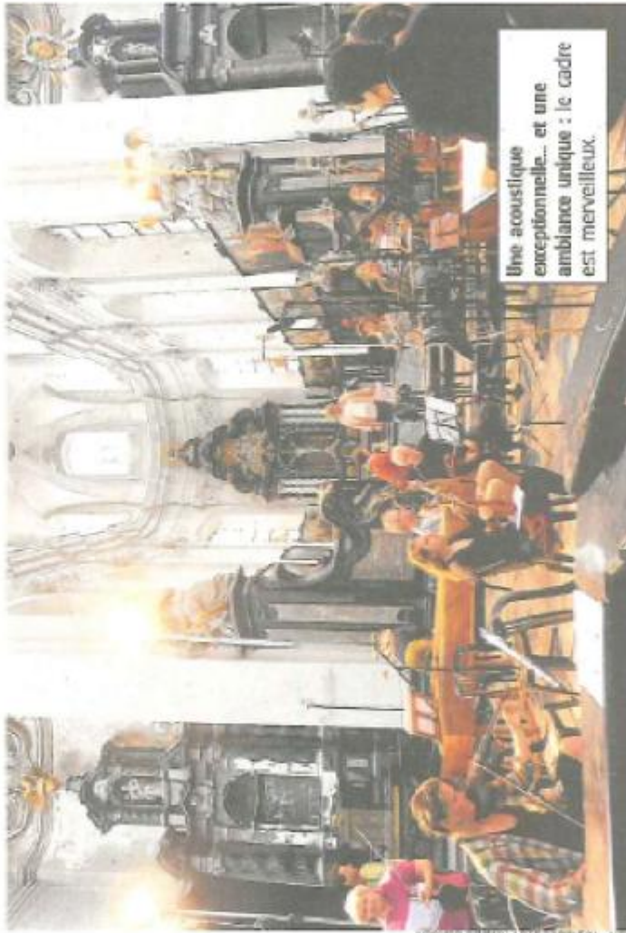
Une acoustique exceptionnelle... et une ambiance unique : le cadre est merveilleux.

En attendant la réalisation du chantier (programmé au début de