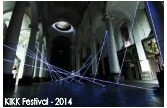
KIKK Festival - 2014