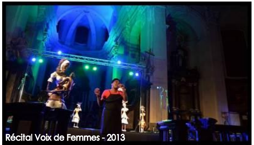
Récital Voix de Femmes - 2013