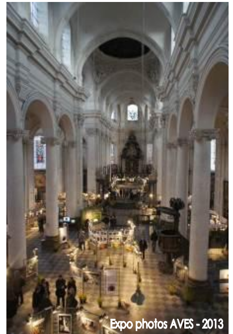
Expo photos AVES - 2013