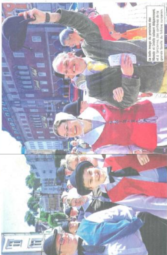
La salue majo du président de Heisingborg et les autres folkloristes de la grande région de l'Europe entière.

Les traditions de la région de Heisingborg, en Suède, sont très riches. Les folkloristes de l'Europe entière ont participé à ce festival. Le festival est un événement de culture, de bouquets et de chansons, d'un autre côté, de nombreux folkloristes et de nombreuses chorégraphes. On a tout fait pour que les folkloristes aient une bonne expérience.