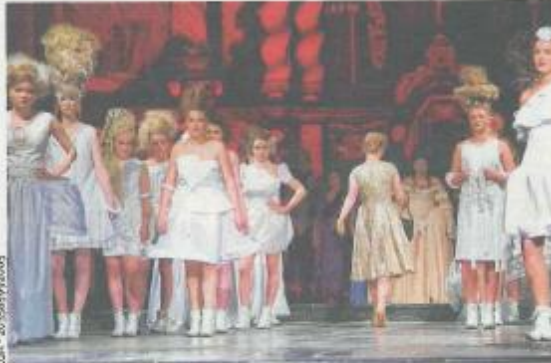
Un travail de précision a été présenté devant 450 spectateurs.

Ce qui fait la particularité de ce défilé, c'est le rassemblement des différents métiers autour d'un but commun. C'est aussi une réelle collaboration entre les jeunes et les professeurs des différentes options qui permet une production que l'on peut dire profes-