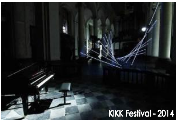
KIKK Festival - 2014