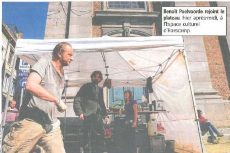
Benoît Poelvoorde rejoint le plateau, hier après-midi, à l'Espace culturel d'Harscamp.

Le film met à l'affiche Catherine Deneuve, Yolande Moreau et Benoît Poelvoorde, mais seul ce dernier était concerné par les scènes namuroises. Jeudi, ce sont des plans extérieurs qui ont été tournés, place l'Illon et rue Saint-Nicolas, impliquant la fermeture de cette dernière.