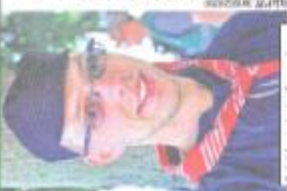
Président de la Comité de l'Européades.