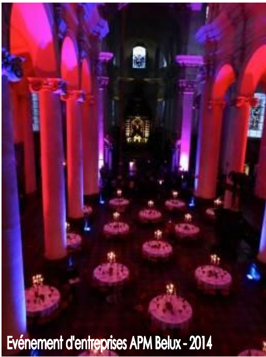
Événement d'entreprises APM Belux - 2014