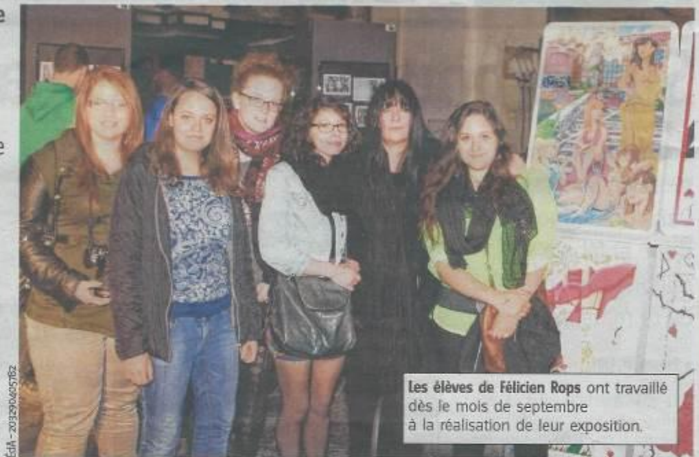
Les élèves de Félicien Rops ont travaillé dès le mois de septembre à la réalisation de leur exposition.

Le coup d'envoi de la troisième édition du parcours d'artistes Chambres avec Vues a été donné le week-end dernier. Cette année, quelque trois cents artistes en tous genres (peintres, sculpteurs, illustrateurs, graveurs, céramistes, stylistes, aquarellistes, photographes, etc.) ont investi plus de deux cents lieux d'exposition situés aux quatre coins de la capitale de la Wallonie. Fort de plusieurs sections touchant aux arts plastiques notamment, mais aussi à la photographie, à la décoration, etc., l'Institut technique de la Communauté française Félicien Rops a décidé de participer, pour la deuxième fois, à Chambres avec Vues . Pour ce faire, l'école namuroise a sollicité une centaine de ses élèves de 5e et 6e années de l'enseignement secondaire, ainsi que d'anciens étudiants. Ceux-ci ont été invités à exposer leurs créations artistiques au sein même de l'église Notre-Dame, à l'espace culturel d'Harscamp, rue Saint-Nico-