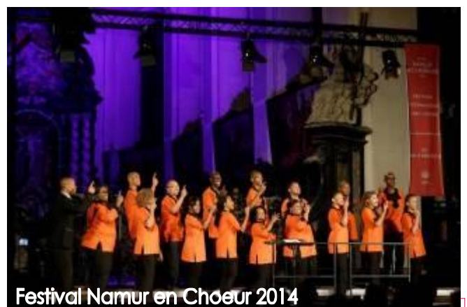
Festival Namur en Chœur 2014