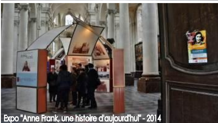
Expo "Anne Frank, une histoire d'aujourd'hui" - 2014