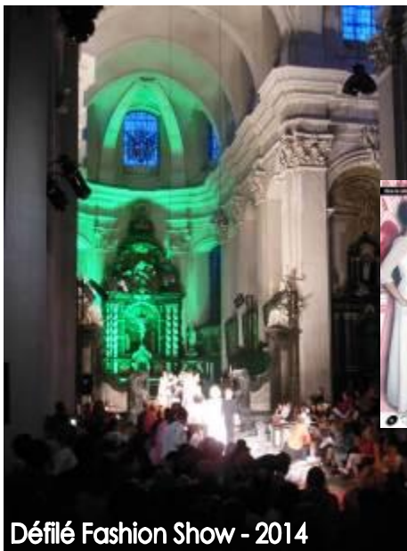
Défilé Fashion Show - 2014