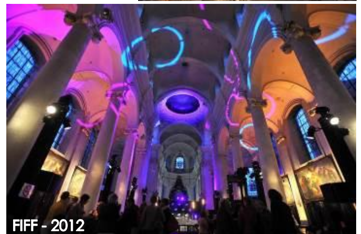
FIFF - 2012