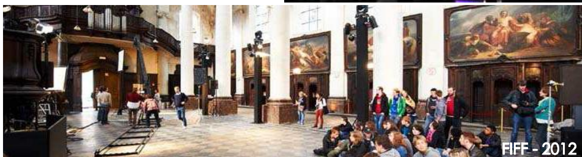
FIFF - 2012