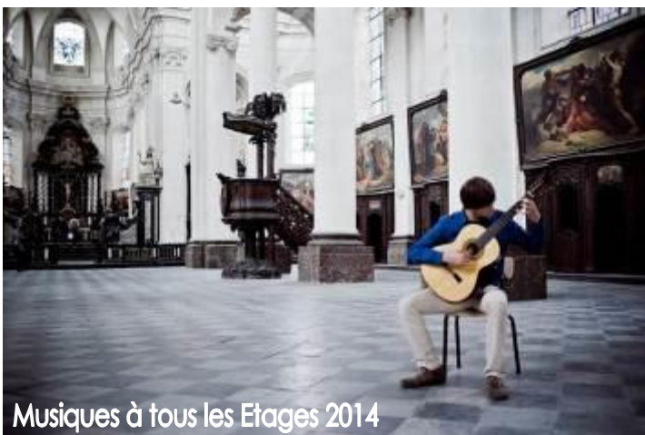
Musiques à tous les Etages 2014