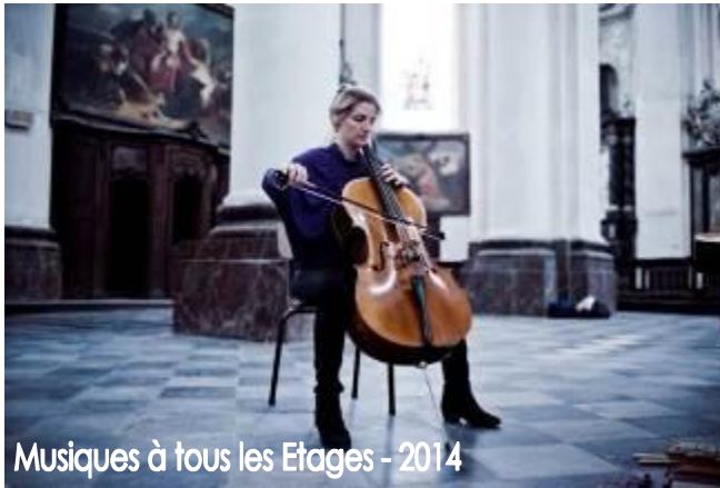
Musiques à tous les Étages - 2014