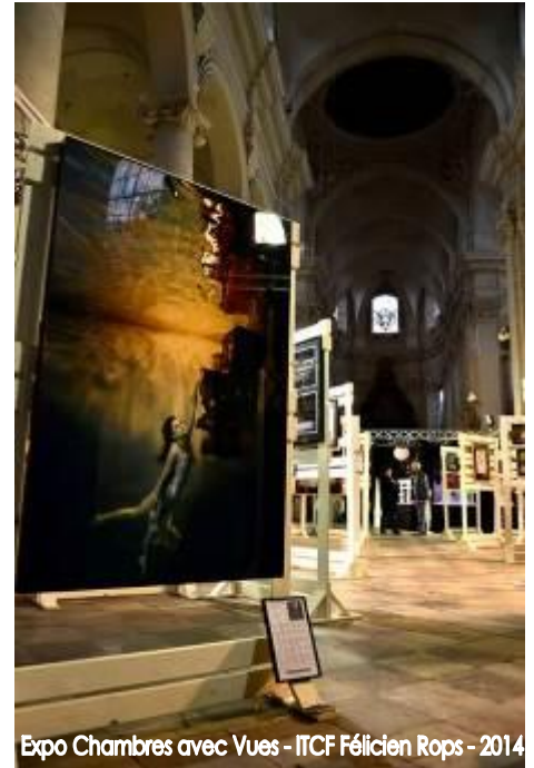
Expo Chambres avec Vues - ITCF Félicien Rops - 2014